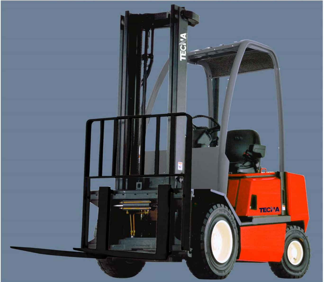
La máquina se muestra con equipo opcional