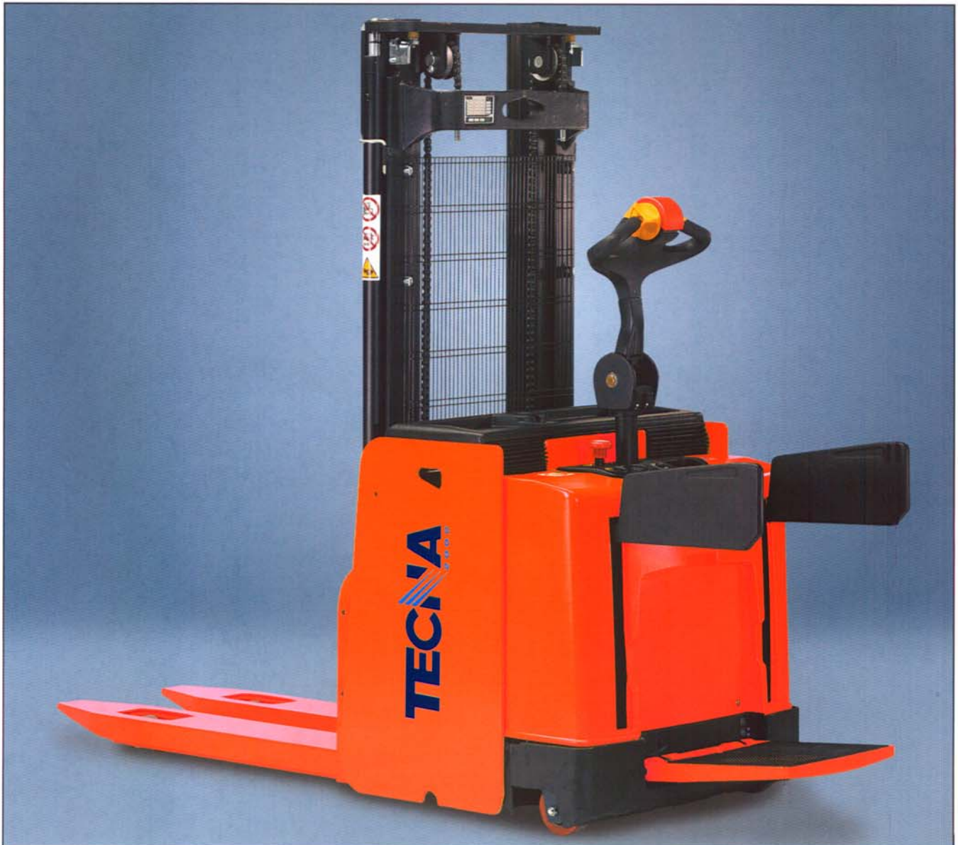
Carretilla con equipamiento opcional